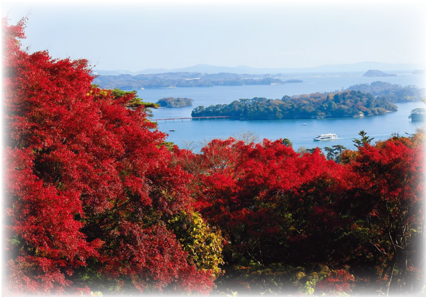
〔二市三町フォトライン〕 秋の松島 西行戻しの松公園からの眺め(松島町)