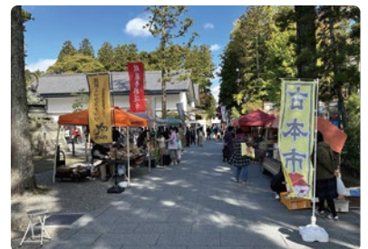
瑞巖寺杉道市 2023年10月22日 (日)