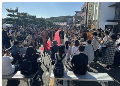
松島町交通社会実験 2023年10月14日 (土)

新型コロナウイルス感染症の影響もまだある中で、「日本三景松島」は賑わいがもどり始めているように感じられます。10月には松島町交通社会実験で国道45号を通行止めで歩行者天国などによるイベントや松島ライトアップ2023も開催されました。また、外国のツアーも多く入っているようで、今後は国内外の観光客についても一日も早く回復していくことを願います。