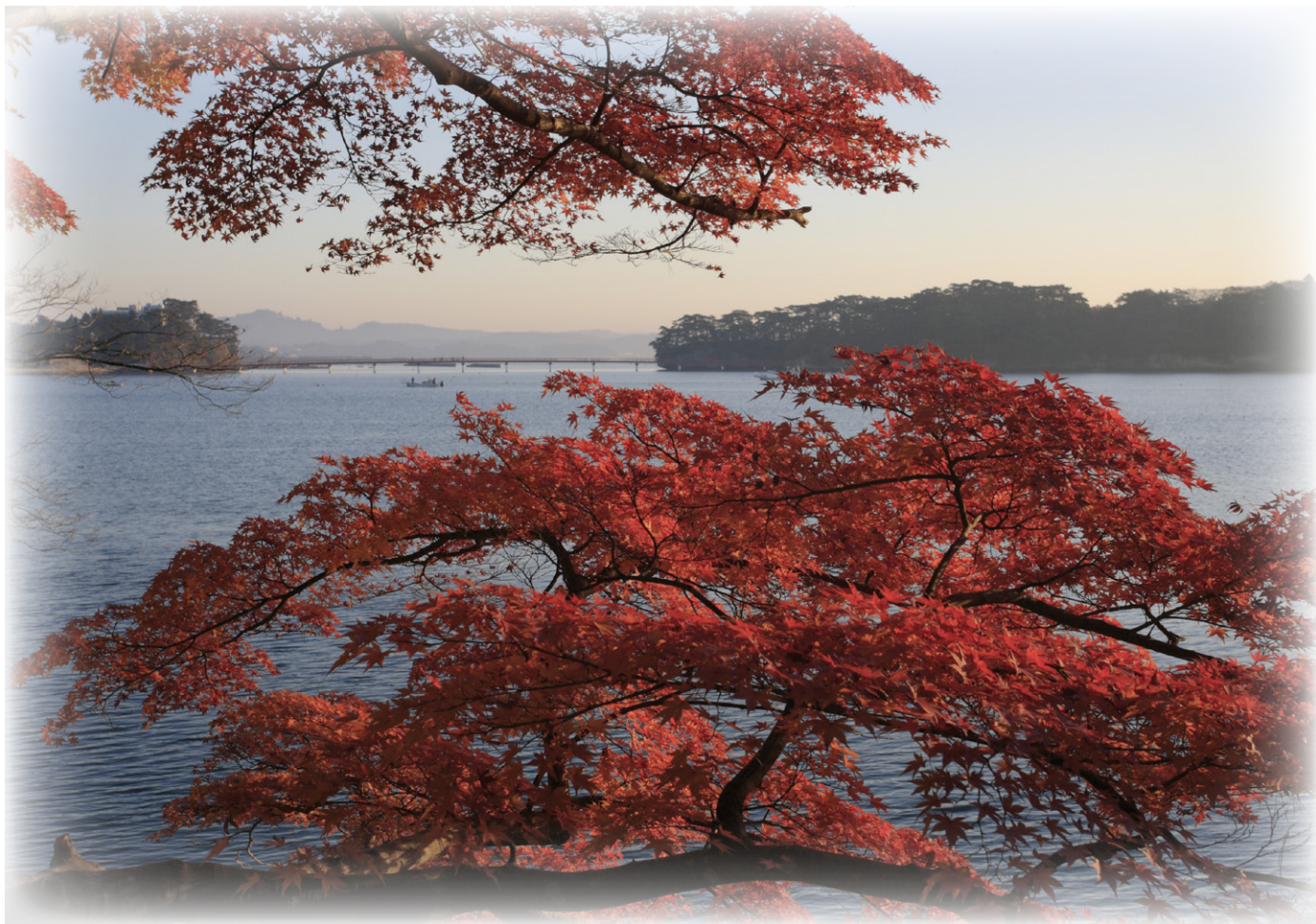
〔二市三町フォトライン〕 秋の松島 雄島からの眺め (松島町)