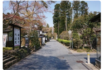
緊急事態宣言中のゴールデンウィーク 2020年4月25日 (土)